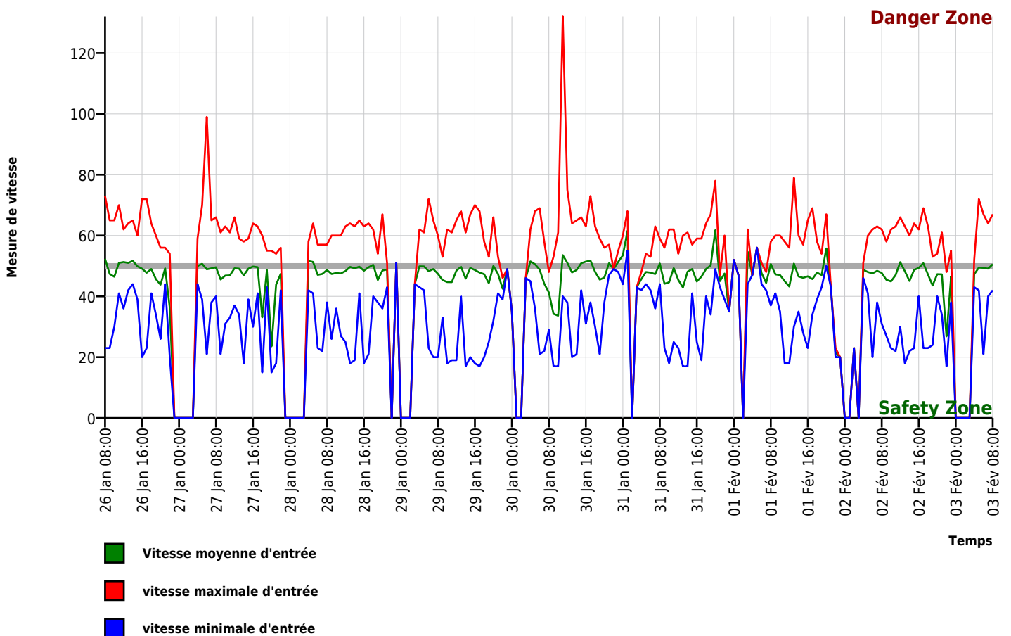
Diagramme de vitesse